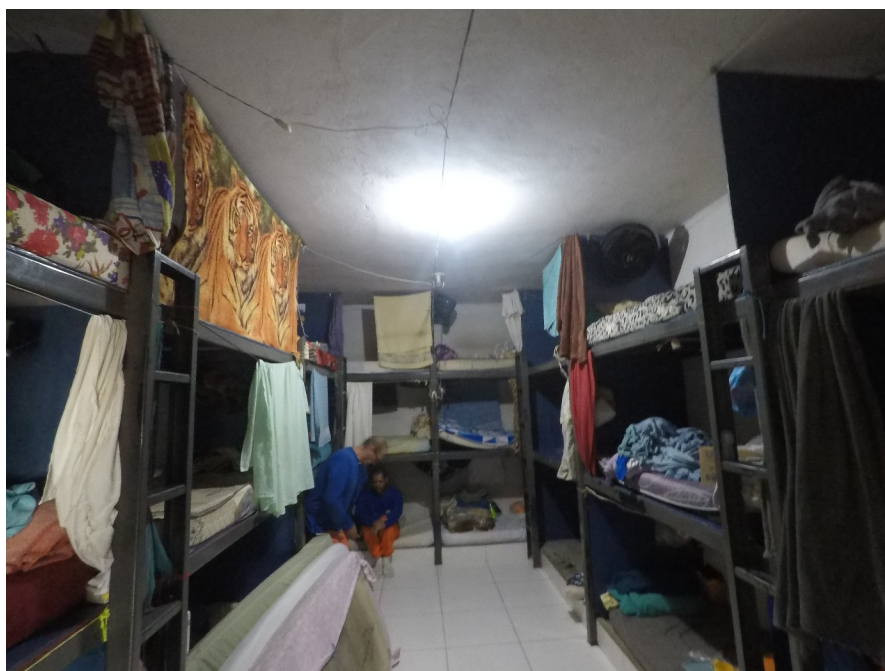
Alojamento dos apenados implantados em trabalho externo