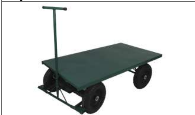
Imagem meramente ilustrativa - Lote 10, 11, 12, 13

1.2.9 Lote 14 e 15 - CARRINHO DE TRANSPORTE TIPO ARMAZÉM - PARA TRANSPORTE DE CARGA (caixas): Carrinho de transporte, tipo armazém, tubular, reforçado. Para Transporte de Carga (caixas). Capacidade aproximada de 200 Kg. Com duas rodas pneumáticas. Material: Aço carbono. Pintura: epóxi.